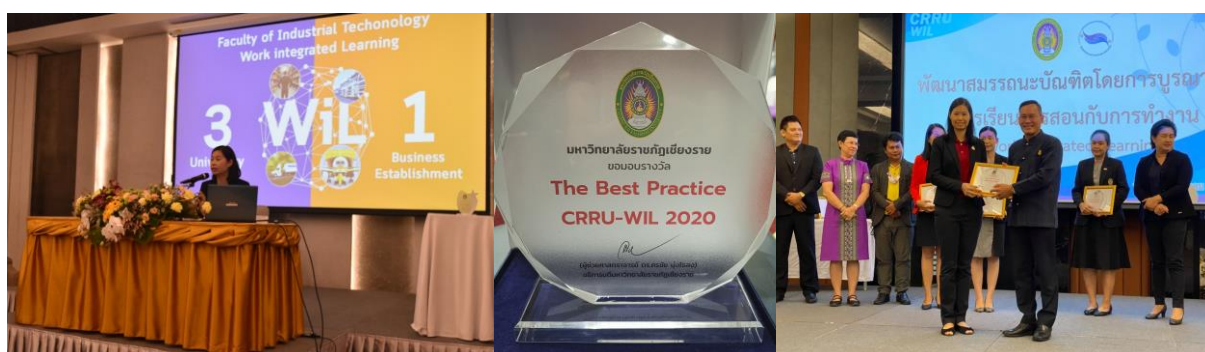
ภาพที่ 7 แสดงการประกวดผลการดำเนินงานภายใต้กิจกรรม “The Best Practice CRRU-WIL”

3.5 มีการกำกับ ติดตาม ผลการดำเนินงานพัฒนาสมรรถนะบัณฑิตเพื่อตอบสนองการพัฒนาประเทศ 4.0 โดยการให้คณะ/สำนักวิชา นำเสนอประกวดผลการดำเนินงานภายใต้กิจกรรม “The Best Practice CRRU-WIL” และจัดทำรายงาน เพื่อสรุปผล กิจกรรมจัดสหกิจศึกษาและการศึกษาเชิงบูรณาการกับการทำงาน ระดับคณะ/วิทยาลัยประจำปีงบประมาณ 2563 และเชิดชูเกียรติหน่วยงานจัดการศึกษามหาวิทยาลัยราชภัฏเชียงราย ในการร่วมขับเคลื่อนยุทธศาสตร์ CRRU-WIL อีกทั้งยังเป็นการเผยแพร่องค์ความรู้ กระบวนการ รูปแบบการจัดการเรียนการสอนบูรณาการกับการทำงานระหว่างหน่วยงานจัดการศึกษาภายในมหาวิทยาลัย ซึ่งเป็นการแลกเปลี่ยนเรียนรู้ร่วมกัน และสามารถนำไปปรับกระบวนการของแต่ละคณะให้เกิดประสิทธิภาพการดำเนินงานการจัดการเรียนการสอนรูปแบบ WIL ในคณะ/สำนักวิชา