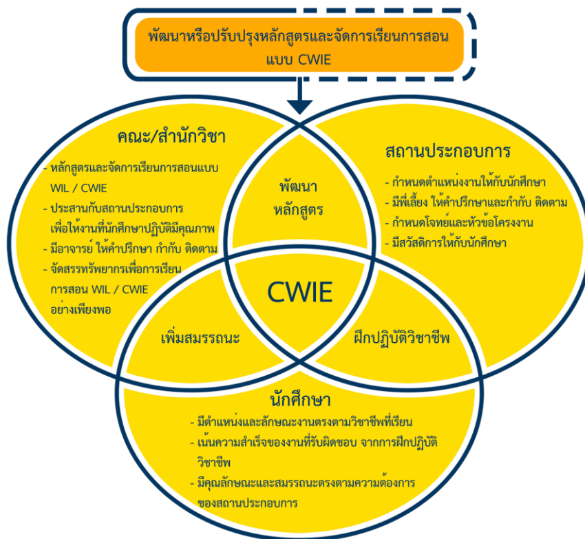
ภาพที่ 2 แสดงกระบวนการเชื่อมโยงดำเนินงานการจัดสหกิจศึกษาและการศึกษาเชิงบูรณาการกับการทำงาน

นอกจากนี้มหาวิทยาลัยราชภัฏเชียงราย ได้มีการทบทวนสรุปผลการดำเนินงานสหกิจศึกษาและการศึกษาเชิงบูรณาการกับการทำงานของหน่วยงานจัดการศึกษาภายในมหาวิทยาลัยราชภัฏเชียงราย โดยมีการประชุมทบทวนโครงการ/กิจกรรม การนำเสนอผลการดำเนินงานตามวัตถุประสงค์การพัฒนาบัณฑิตตามยุทธศาสตร์ การยกระดับด้านการศึกษา โดยทบทวนตามหัวข้อการพัฒนาหลักดังนี้