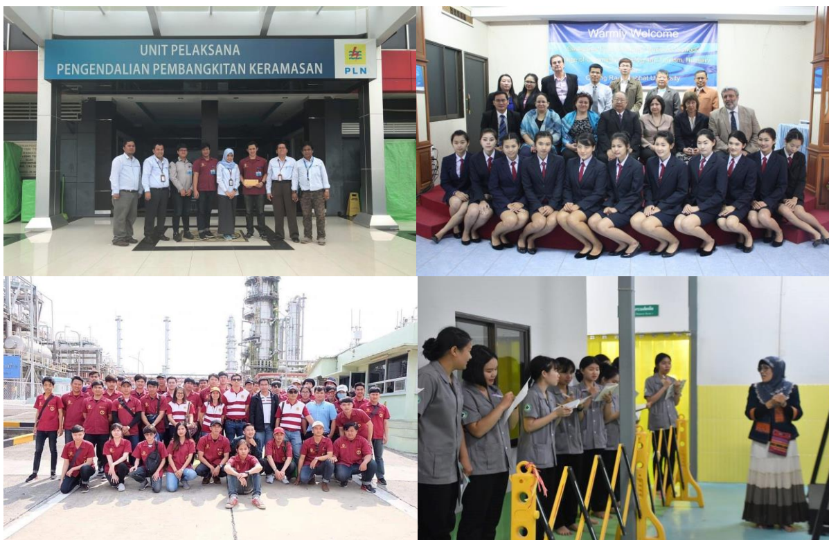
ภาพที่ 9 แสดงการฝึกปฏิบัติของนักศึกษาในสถานประกอบการทั้งในประเทศและต่างประเทศ