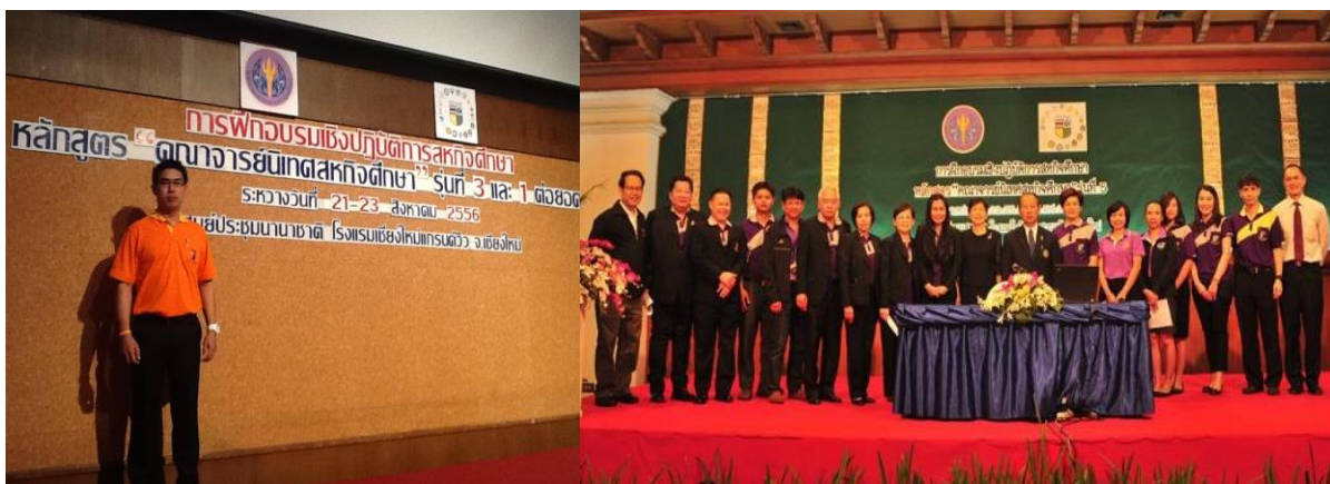
ภาพที่ 4 แสดงการเข้าร่วมอบรมเชิงปฏิบัติการสหกิจศึกษาของบุคลากรมหาวิทยาลัยราชภัฏเชียงราย