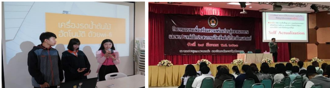
ภาพที่ 1 แสดงการแลกเปลี่ยนองค์ความรู้สหกิจศึกษาและการศึกษาเชิงบูรณาการกับการทำงาน

หลังจากการฝึกปฏิบัติสหกิจศึกษาและการศึกษาเชิงบูรณาการกับการทำงาน ทางคณะ/สำนักวิชาได้จัดให้มีกิจกรรมนำเสนอผลการปฏิบัติสหกิจศึกษาและการศึกษาเชิงบูรณาการกับการทำงาน เพื่อเป็นการแลกเปลี่ยนองค์ความรู้ ประสบการณ์ระหว่างนักศึกษาแต่ละชั้นปี และอาจารย์ รวมทั้งเป็นการประเมินผลการปฏิบัติงานสหกิจศึกษา และนำไปใช้ในการวัดผลประเมินตามข้อบังคับของมหาวิทยาลัยต่อไป