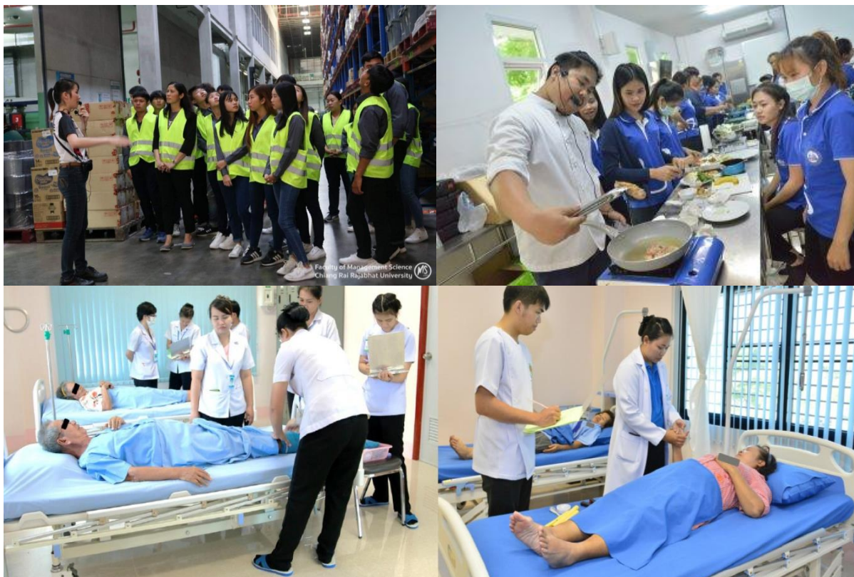
ภาพที่ 5 แสดงการฝึกปฏิบัติจริงในสถานประกอบการของนักศึกษา