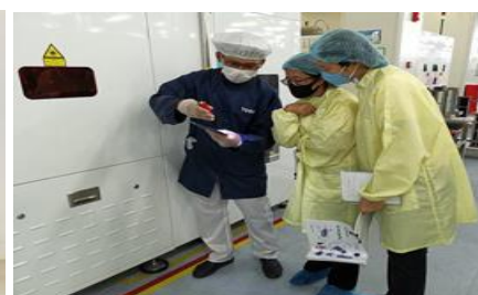
ภาพที่ 3 แสดงการฝึกปฏิบัติ/ฝึกประสบการณ์วิชาชีพและการนิเทศในสถานประกอบการ