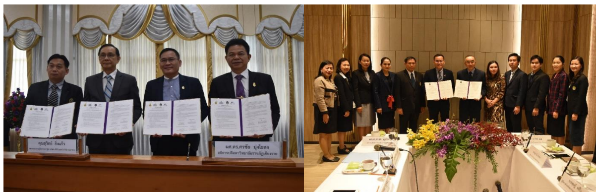
ภาพที่ 8 แสดงการลงนามความร่วมมือทางวิชาการกับสถานประกอบการ

คณะเทคโนโลยีอุตสาหกรรม ลงนามความร่วมมือ (MOU) ระหว่าง สถานประกอบการ M.L.T. Solar Energy Products Co.,Ltd. , บริษัท ป.สยาม ทรานสปอร์ต จำกัด , บริษัท Thai Excel Foods Co.,Ltd. , บริษัท JWD แปซิฟิคห้องเย็น เตรียมความพร้อม เพื่อให้นักศึกษาฝึกปฏิบัติในทุกๆ กระบวนการตลอด 1 ปีการศึกษา และพร้อมรับเข้าทำงานหลังกระบวนการฝึกปฏิบัติงานจริง